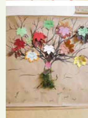
Unsere Werte als Leitbild