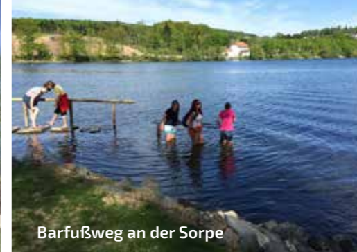
Barfußweg an der Sorpe